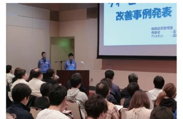
2018年第11回私のかいぜん発表会 会場は満席になりました。